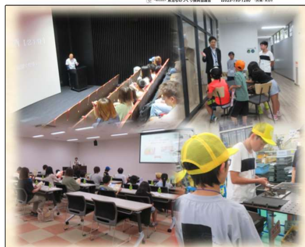
《8/5企業探訪ツアー見学の様子》 魚沼醸造(株)様、テールマーク(株)魚沼水の郷工場様、プレステージ インターナショナル新潟BPO魚沼テラス様、(株)カ化工業様 ご協力ありがとうございました。