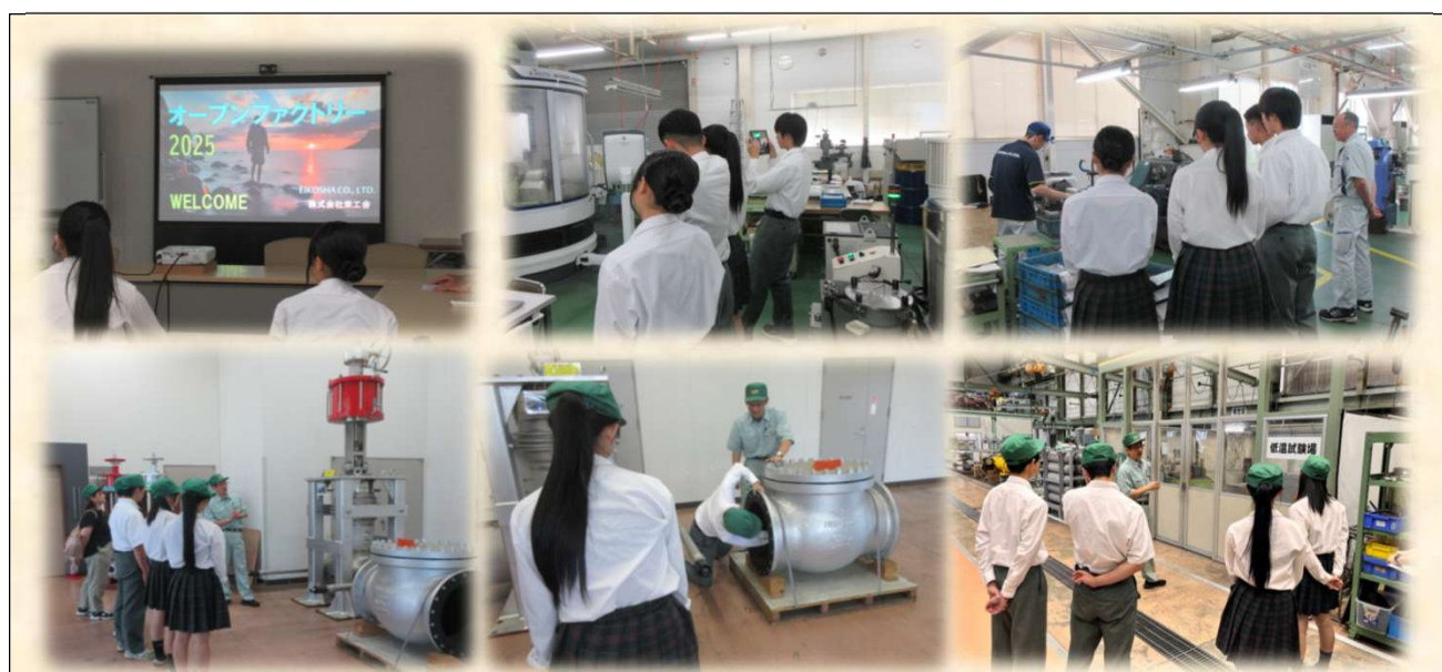
《7/29・30小出高校生見学の様子》 小出高校生に同行させていただきました。 (株)栄工舎様、平田バルブ工業(株)様、ご協力ありがとうございました。